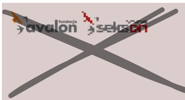
Słaba jakość logotypu