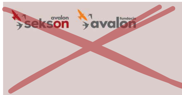
Zmiana kolejności logotypów

Zabrania się jakichkolwiek manipulacji i edycji logotypu bez wcześniejszych konsultacji.