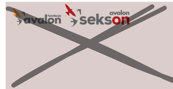
Zmiana wielkości logotypu