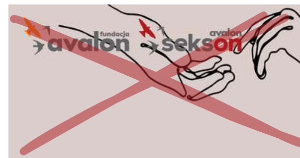
Naruszenie pola ochronnego