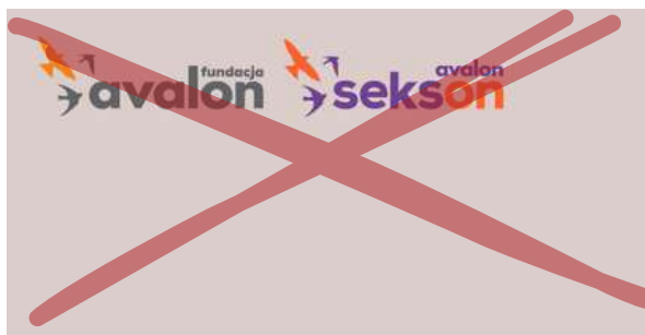
Zmiana koloru logotypu