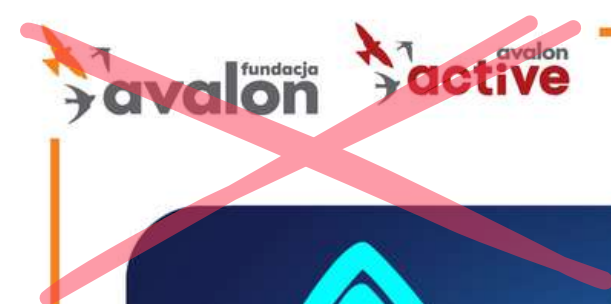
Zmiana wielkości logotypu