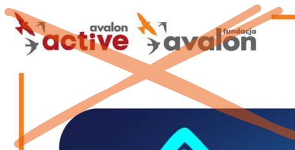
Zmiana kolejności logotypów

Zabrania się jakichkolwiek manipulacji i edycji logotypu bez wcześniejszych konsultacji.