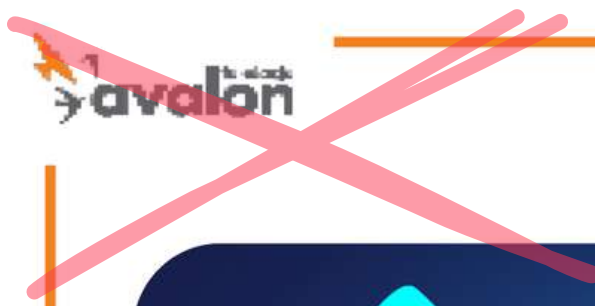
Słaba jakość logotypu