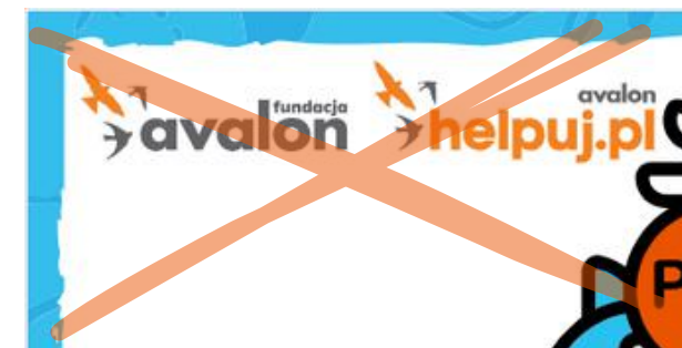
Naruszenie pola ochronnego