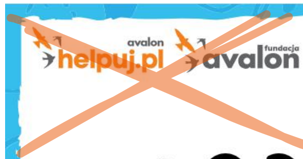
Zmiana kolejności logotypów

Zabrania się jakichkolwiek manipulacji i edycji logotypu bez wcześniejszych konsultacji.