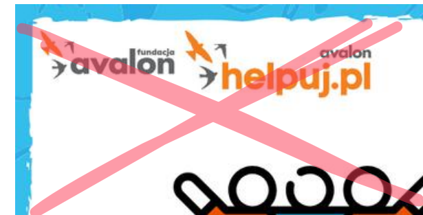
Zmiana wielkości logotypu